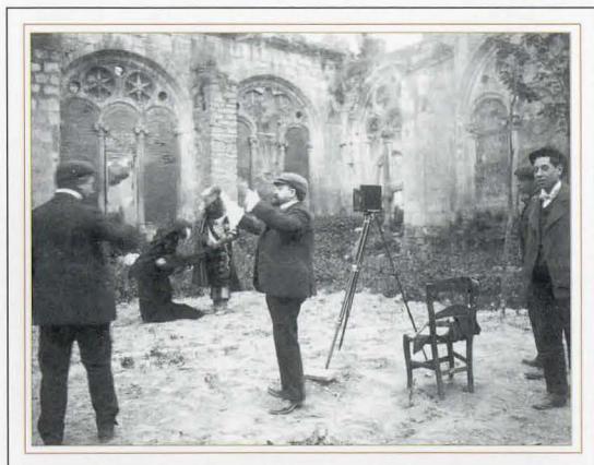
Autor: Pedro Gonzalo Busto (fondo particular de la familia Gonzalo-Bilbao) Archivo Municipal

Gran Cinema Vesa (actual Edificio Ópera)